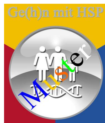
Logo Nr. 3