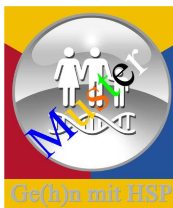
Logo Nr. 2